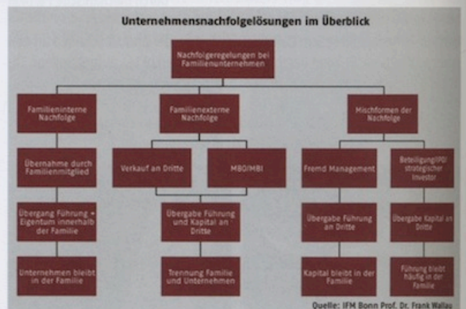
Abbildung 2: Übersicht Formen von Unternehmensnachfolgelösungen für Familienunternehmen.

Die Nachfolge in einem Familienunternehmen ist für alle Beteiligten aufgrund zusätzlicher Komplexität, möglichen unterschiedlichen Interessen und weiteren Anforderungen an den Nachfolger mitunter eine noch größere Herausforderung. Unterschiedliche Varianten mit und ohne Eigentums-/Kapitalübertragung und Leitung durch Familienmitglieder oder Fremdmanagement sind denkbar. Im Gegensatz zum „einfachen“ Unternehmensverkauf bleibt das Unternehmen trotz Nachfolge in der Einfluss- und Interessensphäre der Familie.